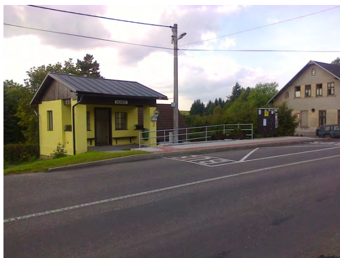
Nástupní hrana u autobusové zastávky