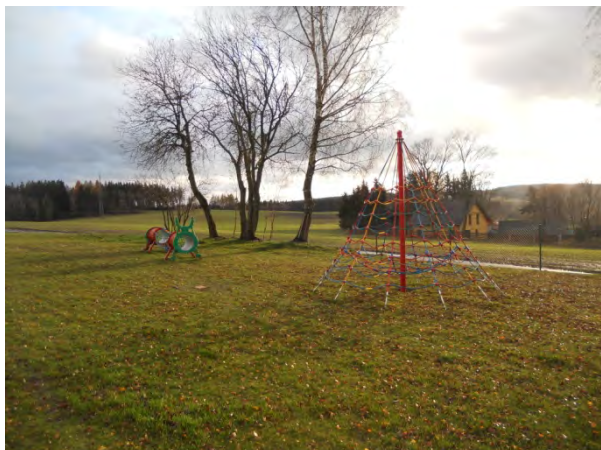
Nové herní prvky na dětském hřišti