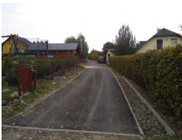
Oprava a odvodnění místních komunikací č. 1306, 1314 a 1315