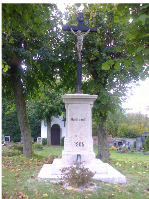
Pomník s křížem na hřbitově