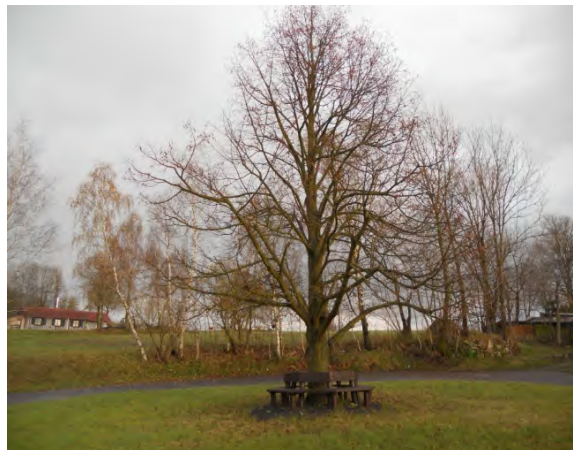
Kruhová lavice u lípy na návsi